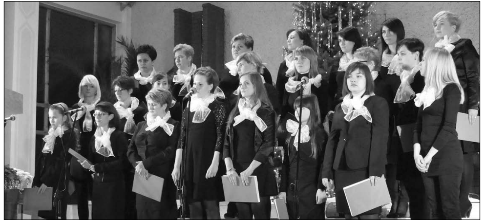
Chór Gloria po raz pierwszy wystąpił na przeglądzie kolędowym