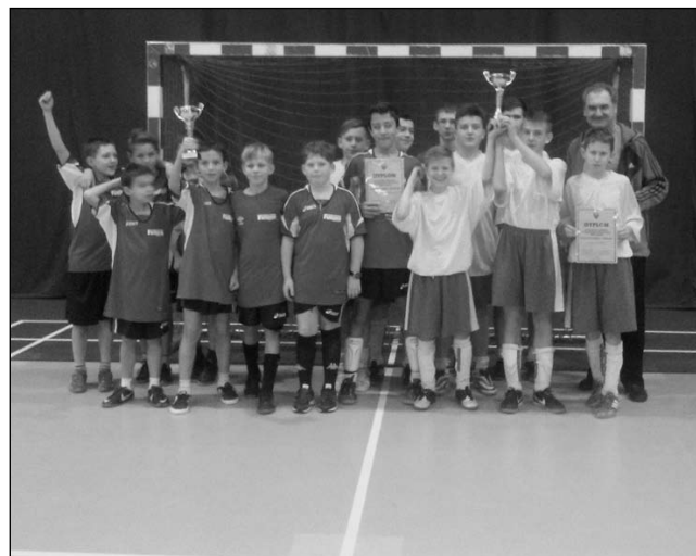
Nowobojszowscy ministranci byli niepokonani.

Wdekanałnym turnieju piłkarskim ministrantów, który 29 listopada odbył się w hali sportowej przy liceum w Bieruniu Starym, dwa razy triumfowali chłopcy z parafii nowobojszowskiej. Mecze rozgrywane były na dwóch poziomach - szkoły podstawowej i gimnazjum.