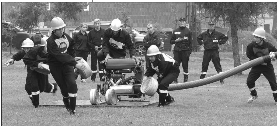
Powyżej zawody strażackie w Świerczyńcu, poniżej lotniarskie w Bojszowach.