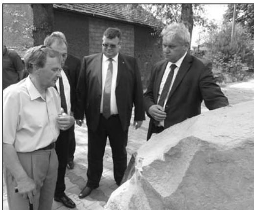
Na Dworzysku zakończono odwodnienie i powstała ścieżka historyczna.