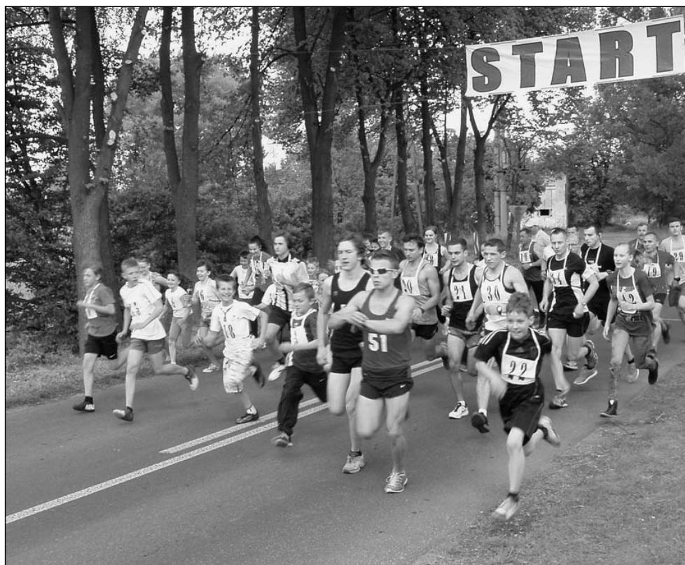
Bieg od Jana do Jana - rekreacja między Jedliną a Bojszowami.