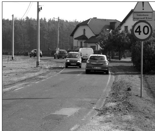
Radni powiatowi zablokowali remont ul. Trzciny w Świerczyńcu.