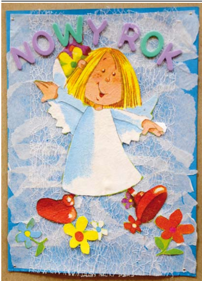
Nowy Rok już blisko. Taką kartkę wykonała w świetlicy szkolnej Kinga Szafron. Otrzymała za nią 2 nagrodę w ogólnopolskim konkursie, na który wpłynęło bez mała pół tysiąca kartek świątecznych i noworocznych.