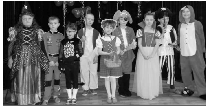
Karnawał - czas zabaw i przebierańców oraz bałów maskowych.