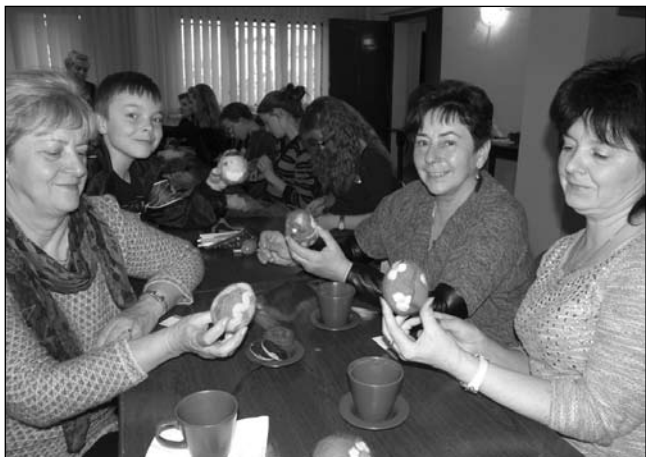
Na zajęciach w bibliotece.