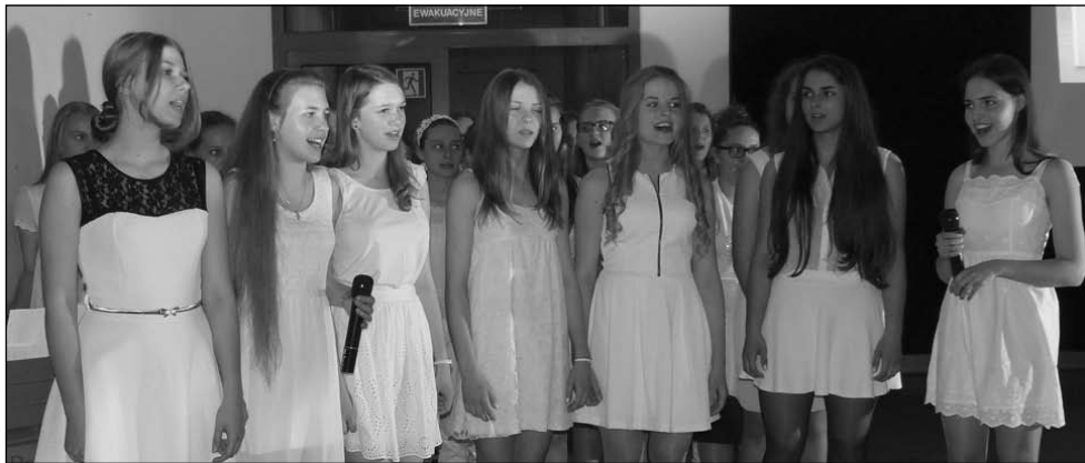
Cantabile to gimnazjalistki, które lubią śpiewać. Zespół co roku w innym składzie.