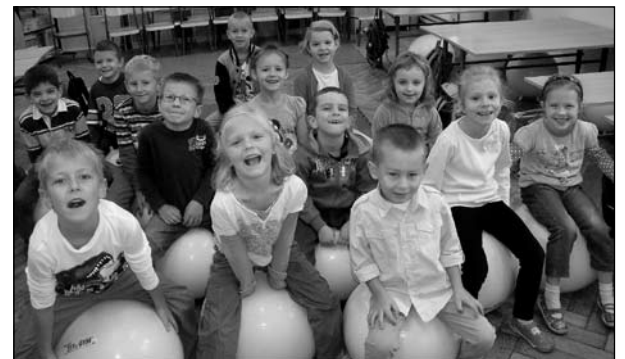
Rozbudowa przychodni i piłki zamiast krzesłek w szkole. Gimnazjaliści z Niemcami w Krakowie.