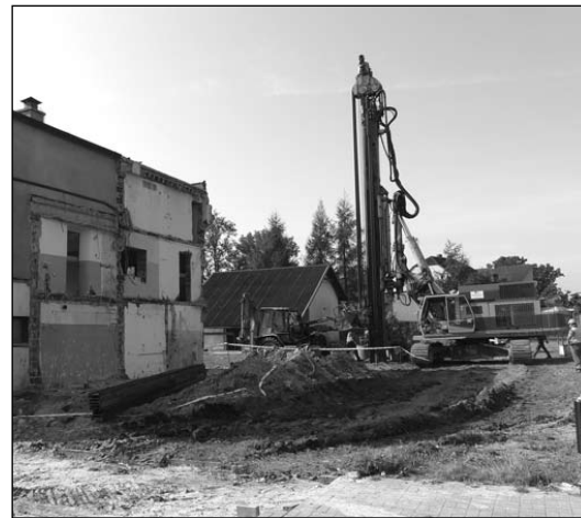
Remonty ulic, rozbudowa biblioteki i budowa przedszkola - to największe gminne inwestycje.